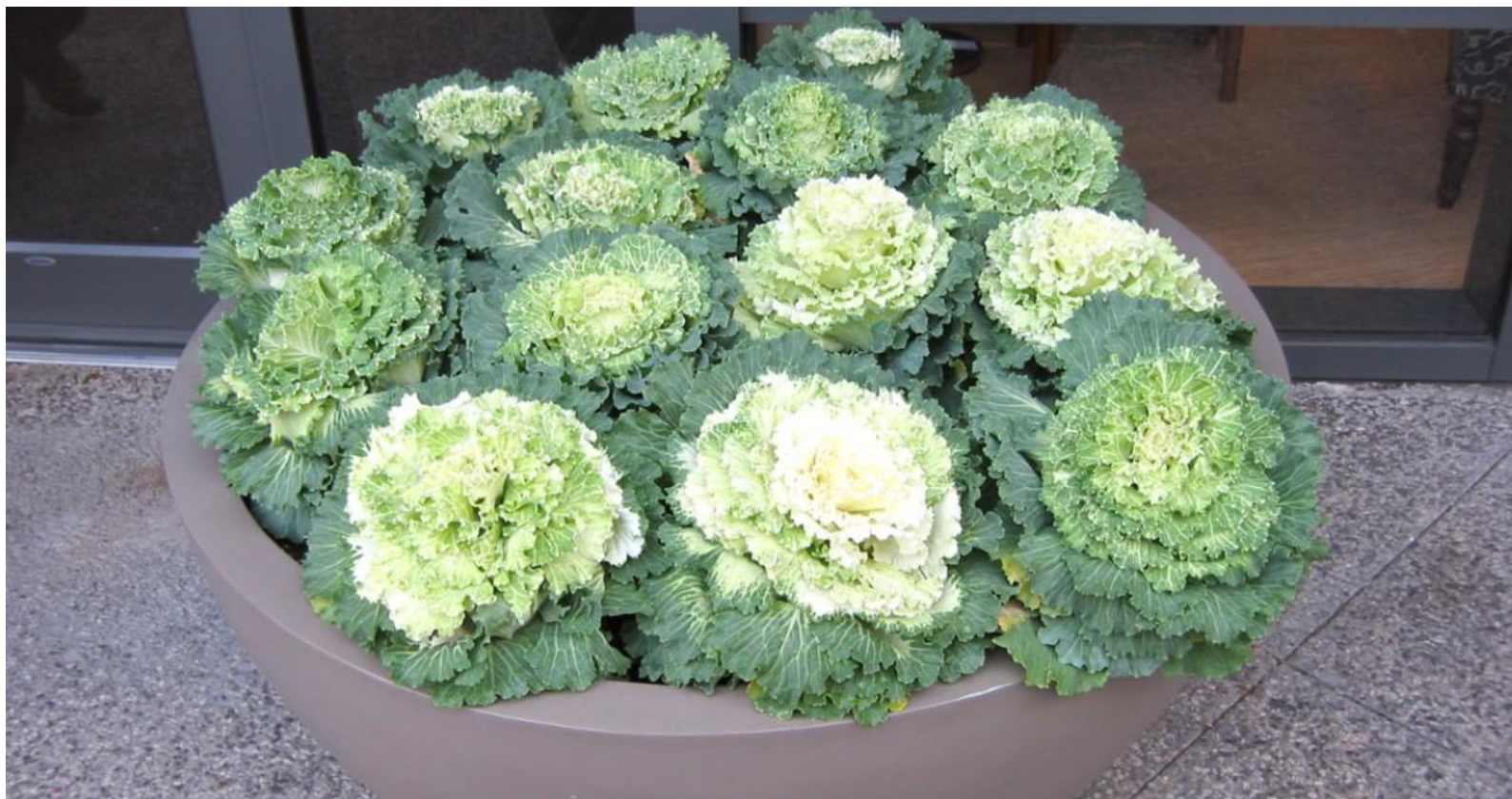
28. Kapusta ozdobna