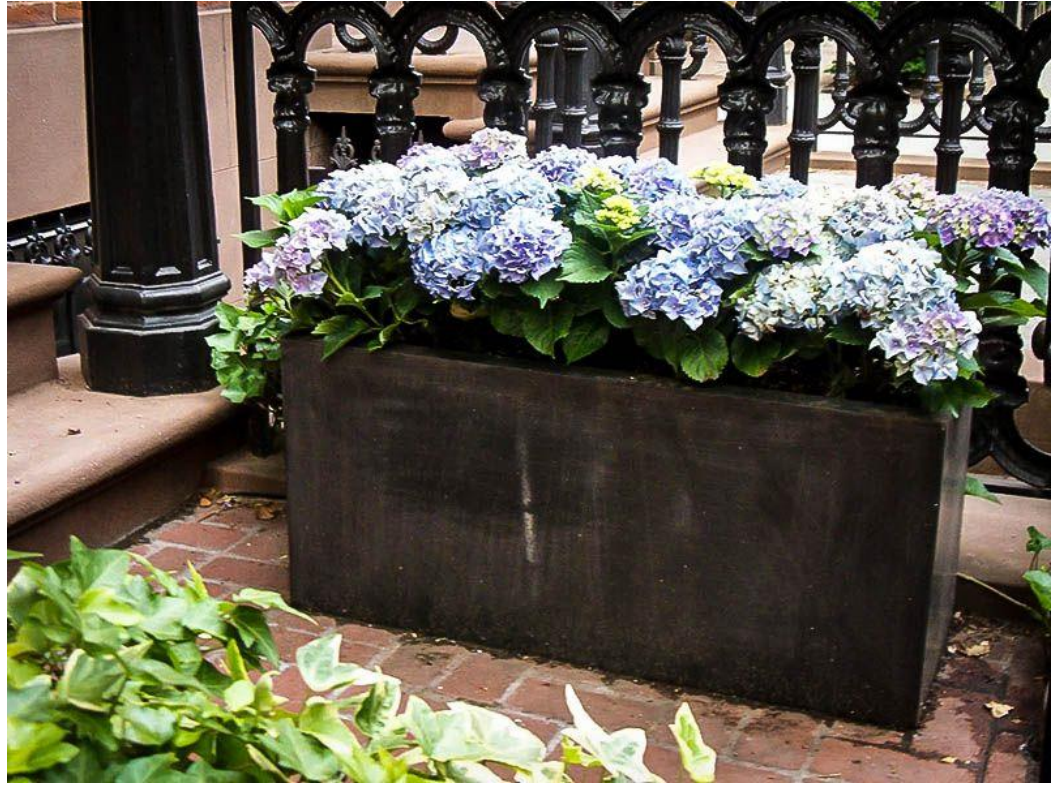
21. Hortensje (np. bukietowe i ogrodowe)