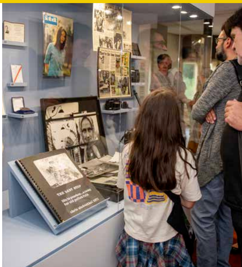
WYSTAWA W MUZEUM MIASTA ŁODZI

W przyjętej Strategii Rozwoju Miasta Łodzi 2030+ określono także kierunki prowadzenia rozwoju miasta, odzwierciedleniem przyjętych w strategii celów jest lista strategicznych przedsięwzięć. Zadania związane z Polityką Rozwoju Kultury